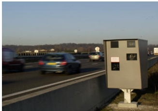
Radars automatiques fixes