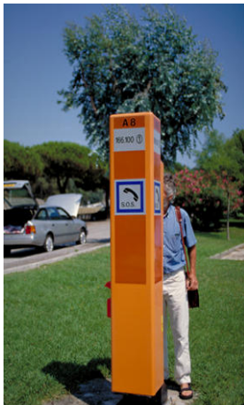
borne d'appel d'urgence

Après avoir protégé les lieux, appelez le 112 (toutes urgences) d'un poste fixe ou d'un portable.