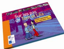
Sur les Pas de Tom et Lila Cycle 2