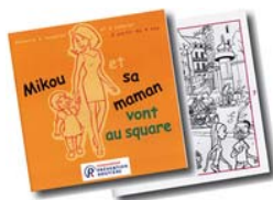
Mikou et sa maman vont au square Cycle 1

Parmi les supports dédiés aux enfants de maternelle et primaire, trois sont consacrés au piéton. L'objectif est de préparer les enfants à devenir des piétons autonomes, capables de circuler à pied en sécurité.