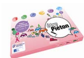
Être Piéton Cycle 3

Mais les enseignants ne sont pas le seul public visé par les associations Prévention Routière et Assureurs Prévention. Les parents ont également un rôle primordial à jouer dans l'éducation routière des plus jeunes. C'est pourquoi elles ont créé en 2006 le site priorite-vos-enfants.fr , sur lequel les parents pouvaient trouver des conseils pratiques pour éduquer leurs enfants à la route, mais aussi des avis d'experts, des jeux pour les petits... L'ensemble de ses contenus a aujourd'hui été intégré sur les sites preventionroutiere.asso.fr (rubrique "Parents") et assureurs-prevention.fr .